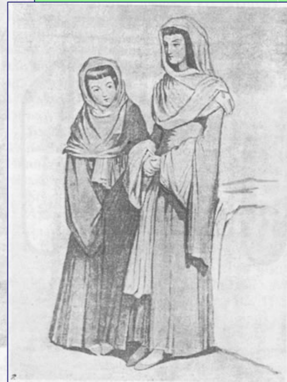
Рис. 2 (продолжение) г — черкесские женщины из Геленджика. 1840-е годы;