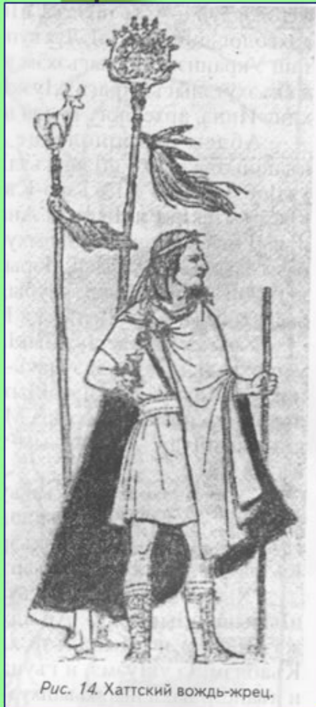
Рис. 14. Хаттский вождь-жрец.