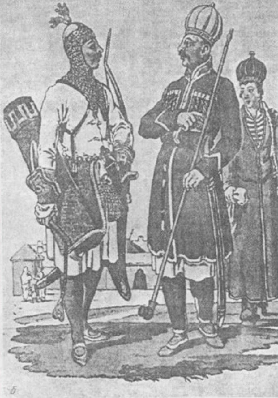
Рис. 1. (продолжение) б) черкес в военной одежде, простой черкес и князь Начало XIX в.