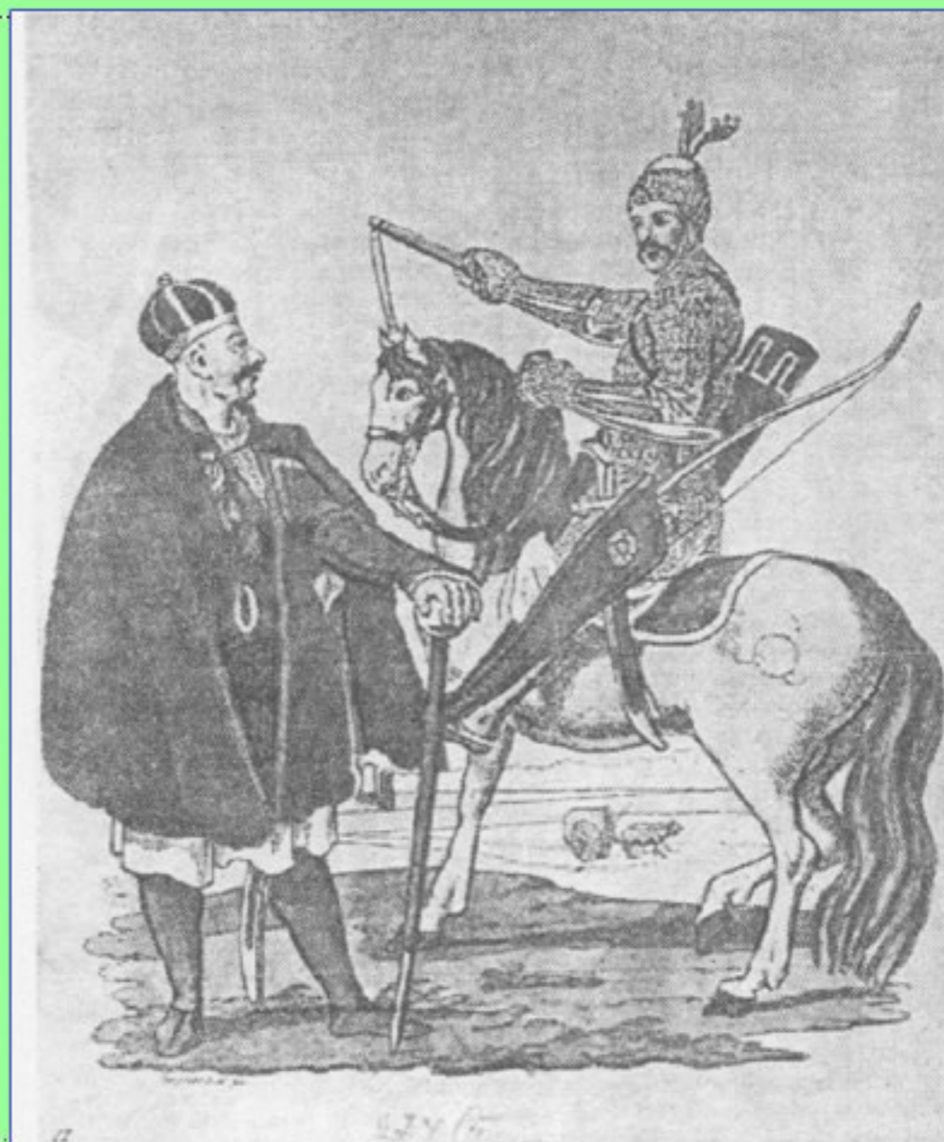
Рис. 1. Одежда адыгских народов и ингушей. XVIII — начало XIX в.

а) черкесский князь и простой черкес. Начало XIX в.;