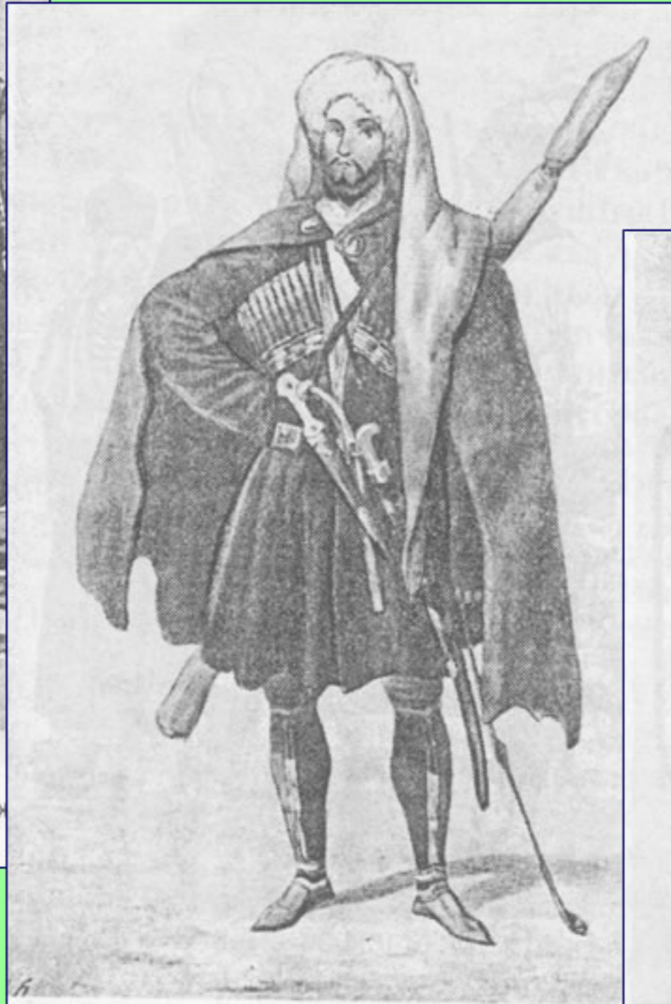
Рис. 2. (продолжение) б — черкес. 1840-е годы;