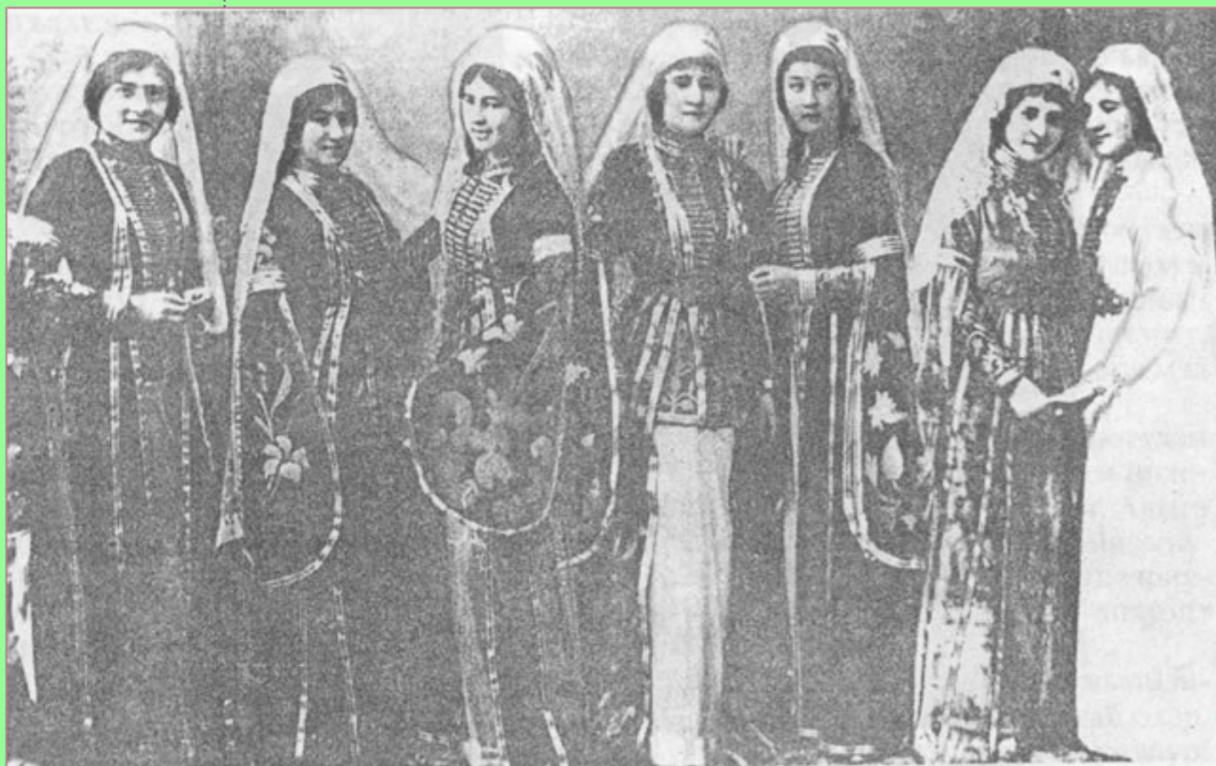
Групповой портрет кабардинок (1890 г.).