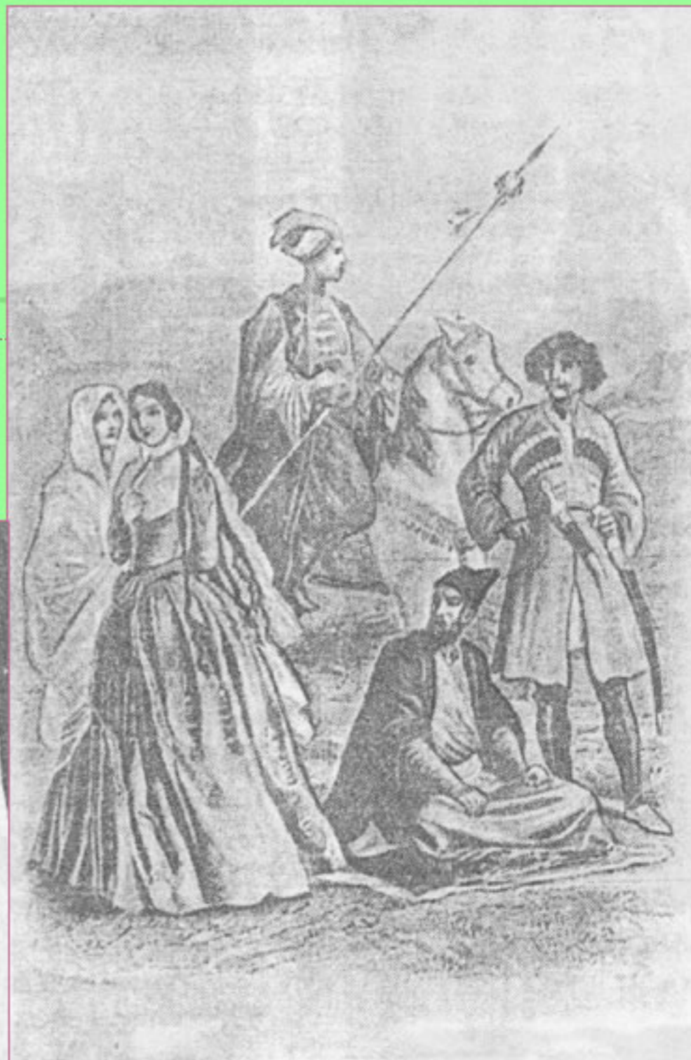
Черкешенки в изображении европейских авторов (18—19 вв.)